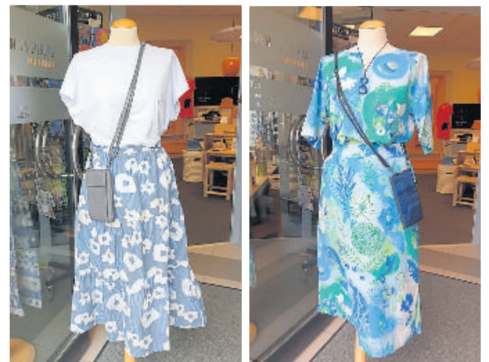
Im August gibt es 30 Prozent Rabatt auf Sommertextilien.

Kontakt: Weltladen ZWEI, Mauerstraße 9, 35781 Weilburg, Telefon 06471-6291450, www.weltladen-weilburg.de .