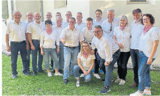
Die Grävenwiesbacher Musikanten.

Alle Informationen rund um die Saison und Karten gibt es im Büro der Weilburger Schlosskonzerte Montag, Dienstag, Donnerstag und Freitag von 9 bis 13 Uhr, zusätzlich öffnet das Büro abends zwei Stunden vor Konzertbeginn in der Schloßstraße 3 in Weilburg, Tel. 06471-944210 und -11. Während der Saison ist das Kartenbüro an den Samstagen von 10 bis 13 Uhr erreichbar.