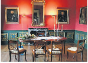
Blick auf den Trautisch, an dem die Standesbeamtin und das Brautpaar Platz nehmen.

Wer im Weilburger Schloss heiraten möchte, kann dieses ganz besondere Ambiente für den „schönsten Tag im Leben eines Paares“ zu bestimmten Terminen in den Monaten April bis Oktober in Anspruch nehmen. Auf der Homepage www.weilburg.de/buergerservice/heiraten-in-weilburg können Interessierte die freien Termine des Jahres 2025 einsehen. Und dann heißt es: rechtzeitig mit dem Standesamt Kontakt aufnehmen und den Wunschtermin buchen. Trauungen im Schloss sind an Freitagen und an Samstagen möglich.