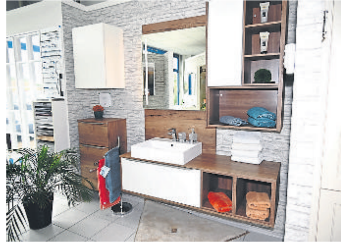
Auch diese Ausstellung wird günstig verkauft.

Kontakt: GEKA Küchenstudio, Auf der Platte 6, 35781 Weilburg, Telefon: 06471-7045, www.geka-kuechen.de .