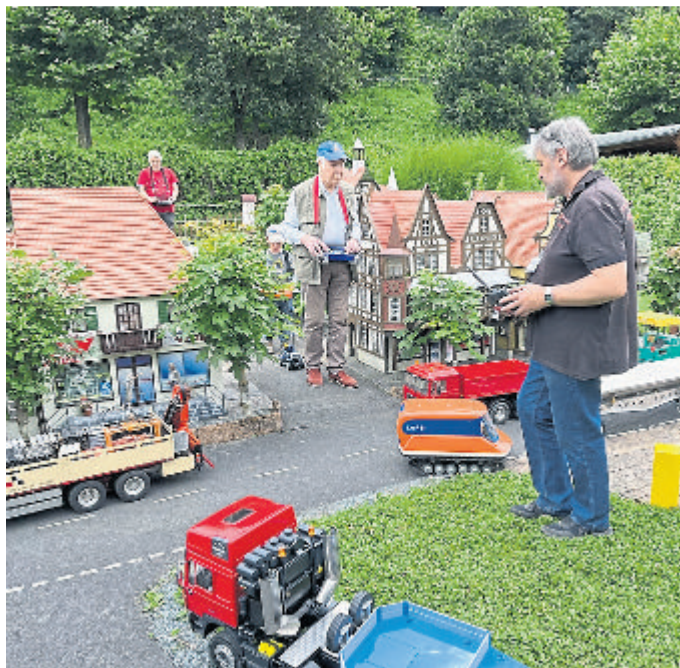
Ob Groß oder Klein: alle haben hier Spaß.

Kontakt: Funktionsmodellbauteam Weilburg, Im Bangert 7, 35781 Weilburg, Telefon: 0171-2441196.