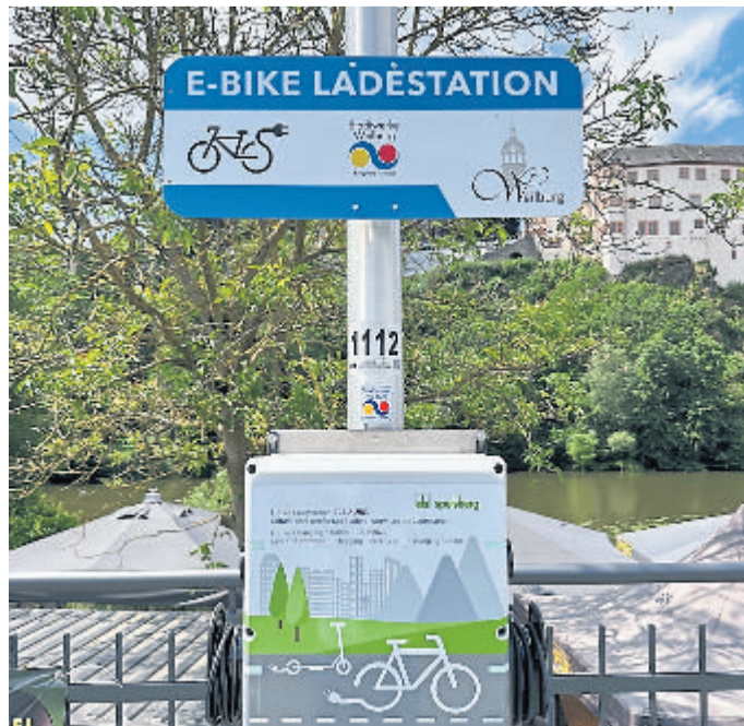
Bis zu vier E-Bikes können hier geladen werden.