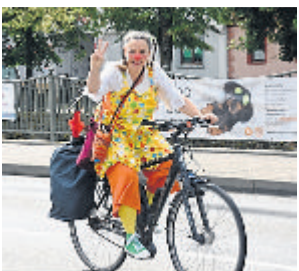
Auch eine Clownin war dabei.

(red). Am Sonntag, 4. August, findet zum 19. Mal der Autofreie WeitalSonntag statt. Alle sind eingeladen, das schöne Weital zwischen Rod an der Weil und Weilburg zu Fuß, mit dem Fahrrad oder auf Skates und anderen Rädern zu entdecken. An diesem Tag ist die Weitalstraße (Landesstraße 3025) für den motorisierten Verkehr von 9 bis 17 Uhr gesperrt. Jede Menge Aktionen und Verpflegungsstationen entlang der rund 30 Kilometer langen Strecke von Weilrod über Weilmünster und Weinbach/Freienfels nach Weilburg erwarten die Gäste. In Weilburg kann man sich über den Verein „Pro-Polizei Weilburg“ informieren und sich dabei in dem direkt danebenliegenden Restaurant „Jimmys“ kulinarisch stärken. Eine weitere Besonderheit ist die eigens kreierte Fahrrad-Stadtführung des Kur- und Verkehrsvereins Weilburg, die um 11 Uhr ab dem Restaurant „Jimmys“ an der Guntersau startet und entlang zum Schiffstunnel und Schleuse sowie zum Weinkeller mit Terrassengärten und in Richtung Altstadt führt. Ausreichend Parkplätze stehen kostenlos in der Straße „Im Bangert“ und im sich anschließenden Bereich der Wohnmobilstation in Weilburg zur Verfügung. Weitere Infos unter www.autofreiesweital.de .