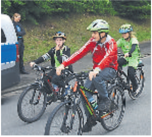
Eindrücke vom letzten WeitalSonntag.