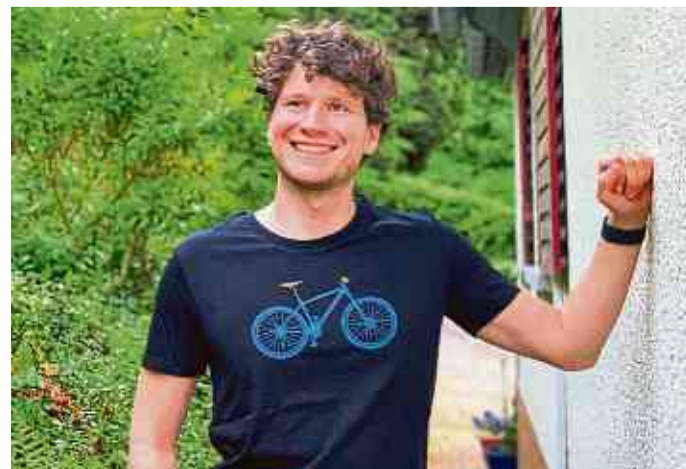
Mit oder ohne Aufdruck gibt es T-Shirts für Herren.

Kontakt: Weltladen Weilburg ZWEI, Mauerstraße 9, 35781 Weilburg, Telefon 06471-6291450, www.weltladen-weilburg.de .