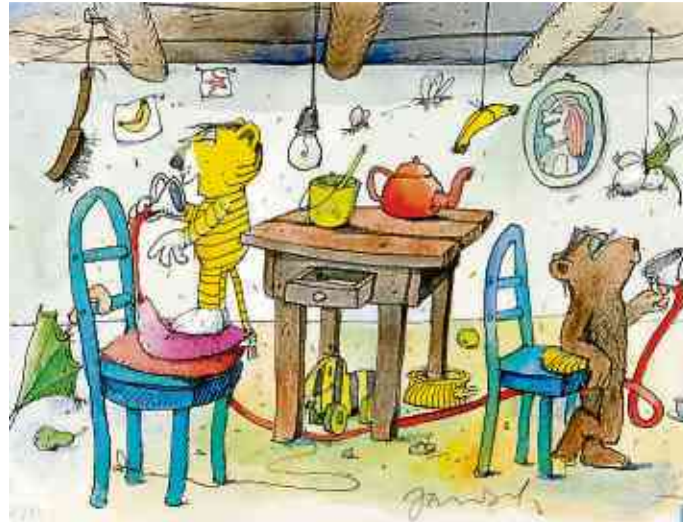
Eines der ausgestellten Werke.

von 93 Jahren das Weltgeschehen noch interessiert und aufmerksam betrachtet und kommentiert.