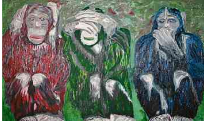
„The three monkeys“: Auch dieses Bild wird versteigert.

und „Dom zu Limburg“. Die Lions und natürlich auch der Künstler freuen sich auf viele Besucher und Auktionsteilnehmer.