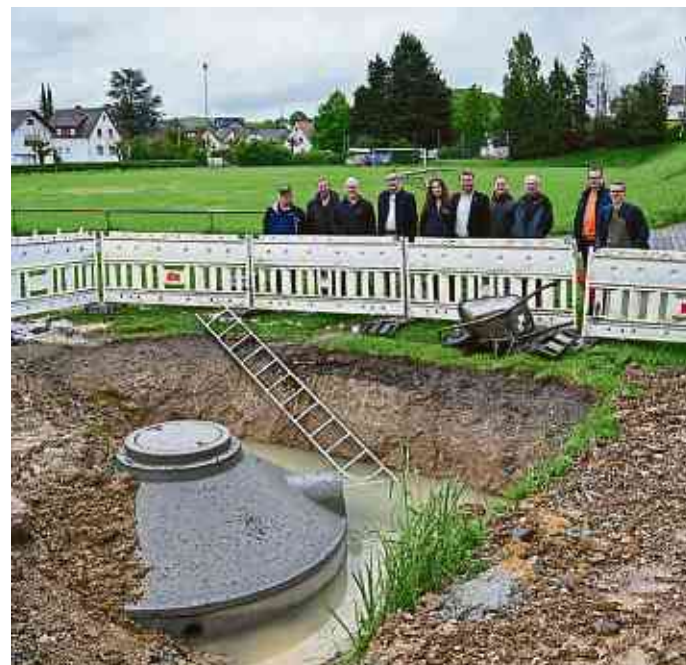
Eine der drei Zisternen ist noch zu sehen, die anderen beiden befinden sich schon unter der Erde.