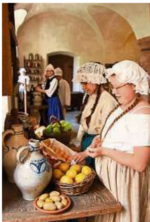
Szene in der Schlossküche.

(red). Die Weilburger Heinrich-von-Gagern-Schule nimmt ihre Besucher wieder am Samstag, 25. Mai, und am Sonntag, 26. Mai, jeweils von 11 bis 16 Uhr (letzter Einlass) mit auf eine historische Zeitreise durch die Geschichte des Weilburger Schlosses. Das museumspädagogische Projekt, welches im nächsten Jahr 20 Jahre alt wird, zeigt wieder Szenen aus den letzten drei Jahrhunderten.