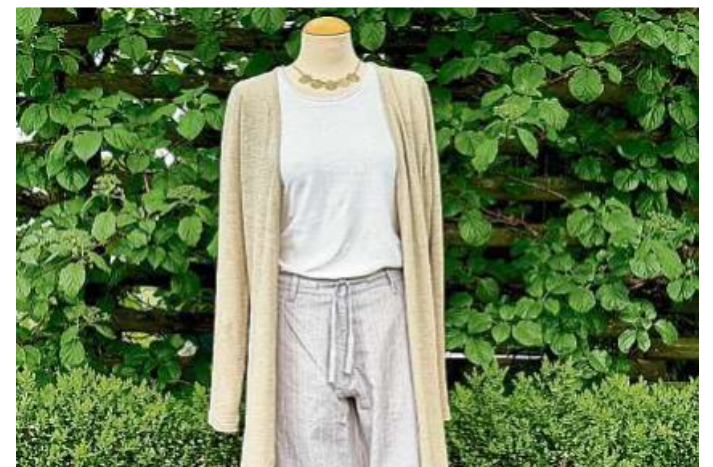
Kleidung aus Hanf.

Kontakt: Weltladen Weilburg ZWEI, Mauerstr. 9, 35781 Weilburg, Telefon 06471-6291450, www.weltladen-weilburg.de .