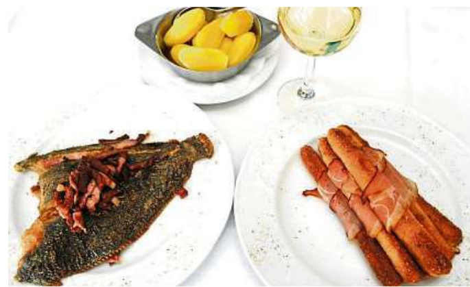
Grissini vom Spargel und Maischolle mit Speck: sie schmecken beide wunderbar.

Kontakt: Gasthaus Neu zum Westerwald, Löhnberger Str. 24, Löhnberg-Niedershausen, Telefon 06471-61233, www.gasthaus-neu.de .