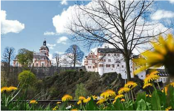
Frühlingsblick auf das Weilburger Schloss.