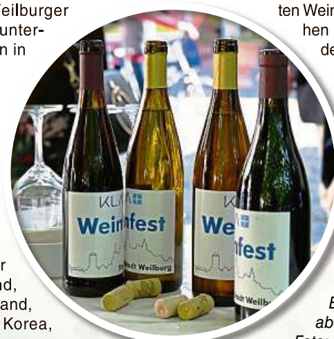
Eigene Abgabe.