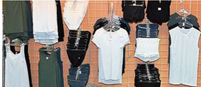
Funktionsunterwäsche in großer Vielfalt.

Kontakt: Hermko, Marktstraße 6, 35781 Weilburg, Telefon 06471- 2195.